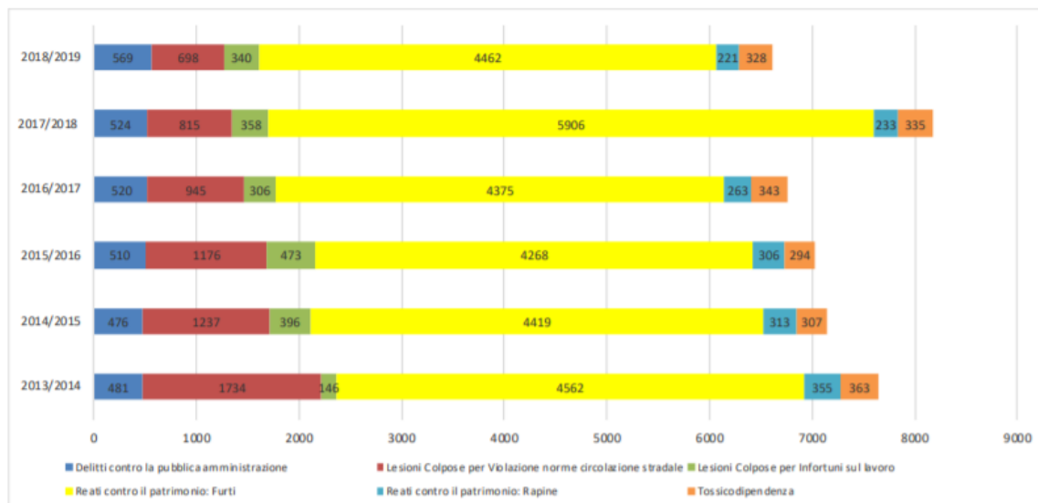
Figura 7: Principali tipologie di reato. Fonte: elaborazione su dati per relazione di apertura dell'anno giudiziario

(fonte: Bilancio sociale 2019 della Procura della Repubblica di Pavia https://lab24.ilsole24ore.com/indice-della-criminalita/index.php ; https://www.transparency.org/en/cpi )